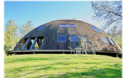
Siège de Natarys